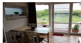
Blick zum Deich